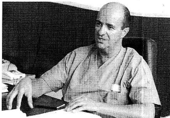
Il chirurgo maxillo-facciale Enrico Sesenna. In alto, alcuni bambini di Khulna.

bambina ha delle malformazioni, non ci sono speranze. L'intervento quindi - spiega Sesenna - più che una funzione estetica ha una valore sociale, di riscatto per queste ragazzine che, altrimenti, sarebbero