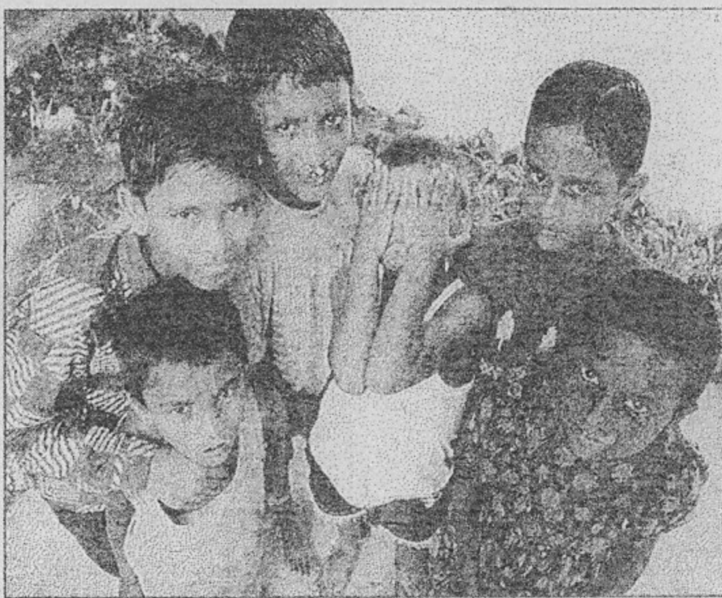
Due cartoline scaricabili dal sito www.progettosorrisonelmondo.it da inviare per sostenere il programma di aiuti in Bangladesh