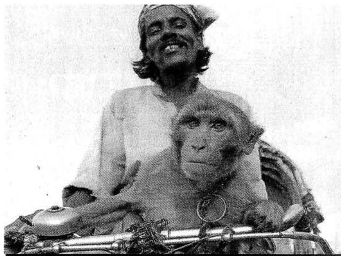
SULLA STRADA Nel Bangladesh per sopravvivere si accetta ogni lavoro

Nel 2002 il fotografo Guido Harari ha seguito la missione di progetto Sorriso in Bangladesh e ha documentato il lavoro dei medici in questo angolo di mondo. Il risultato è un reportage unico, che sarà presentato il 6 settembre alle 18 presso la libreria Feltrinelli in piazza Piemonte 2. «Gli scatti di Harari - afferma il chirurgo - non mostrano il dolore, ma la felicità di quei bambini a cui è stato ridato il sorriso. Le fotografie testimoniano quanto bene si può fare». Guido Harari è uno dei maggiori ritrattisti italiani e ha voluto dare il proprio contributo al Progetto Sorriso facendo quello che meglio gli riusciva. «Nessuno di noi nasce missionario, nessuno di noi è un missionario - afferma Di Francesco -. Ognuno però ha una professionalità che può contribuire a cambiare, in meglio, la vita di un bambino».