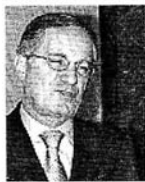
Navone: «Dipendenti da encomiare per l'impegno»

■ Si è alzato ieri il sipario sull'ospedale S. Anna vestito a festa e trasformato in un congresso. Nonostante i noti problemi della struttura di via Napoleona, la carenza di personale e da ultimo le inchieste della magistratura, il nosocomio cittadino sta cercando con questo