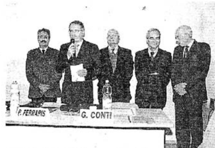
OPERAZIONE RILANCIO La presentazione della mostra ieri al Sant'Anna