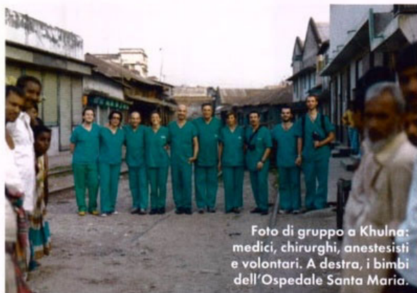
Foto di gruppo a Khulna: medici, chirurghi, anestesisti e volontari. A destra, i bimbi dell'Ospedale Santa Maria.